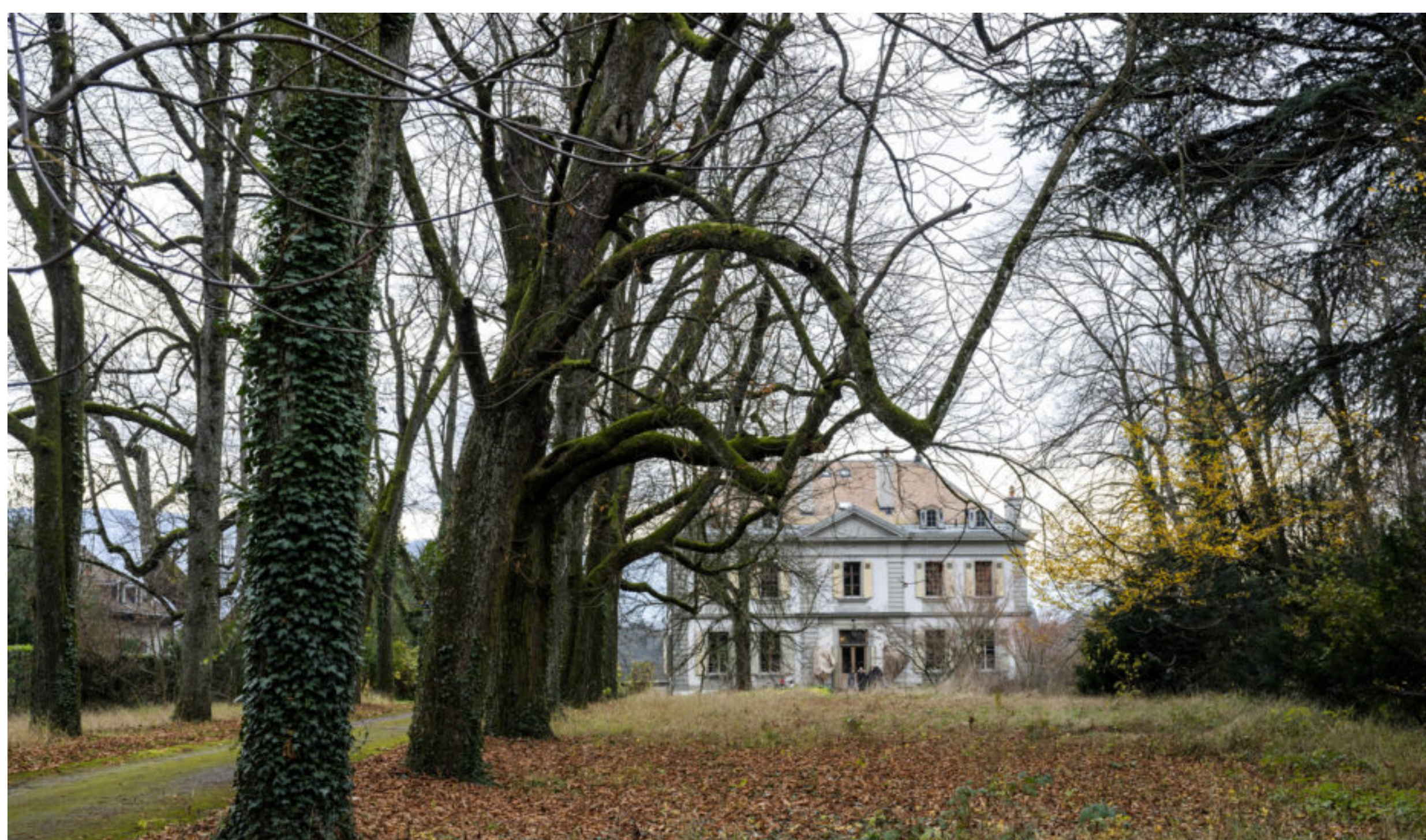
Située dans le quartier des Charmilles, la Campagne-Masset est une maison de maître bordée de 34 000 mètres carrés de terrain.

PARC ► La volonté du Conseil municipal de la Ville de Genève d'acheter pour 21,5 millions de francs la Campagne-Masset, une maison de maître bordée de 34 000 mètres carrés de terrain, dans le quartier des Charmilles, a du plomb dans l'aile. Et cela inquiète les soutiens. La bâtisse appartient au dessinateur Philippe Chappuis, plus connu sous le nom de Zep. Le père de Titeuf l'avait mise en vente pour 25 millions de francs. Il la cèderait à la Ville pour un prix inférieur. Or, la transaction est menacée par le lancement d'un référendum annoncé par des élu·es du PLR, du Centre, de l'UDC et des Vert·libéraux.